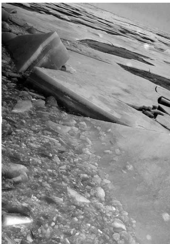
Arctisch uitzicht

De escalerende militarisering van de poolwateren en de race naar de Noordpool zijn echter slechts twee facetten van het Arctische conflict. Zolang de United Nations Commission on the Limits of the Continental Shelf (UNCLCS) immers geen uitspraken doet over de territoriale disputen, blijven kwesties zoals het uitbreiden van Exclusieve Economische Zones (EEZ) bevroren. Dit economische aspect van de kwestie werd een erg belangrijk strijdpunt, gezien een geologische survey heeft uitgewezen dat maar liefst 25% van de onontdekte olie- en gasreservoirs op aarde zich in de Arctische regio bevindt. Maar niet alleen deze grondstoffen zijn qua economisch potentieel van primordiaal belang, ook vis, hout en mineralen zijn rijkelijk aanwezig. Het is dan ook niet onverwacht dat bepaalde staten dit potentieel willen exploiteren.