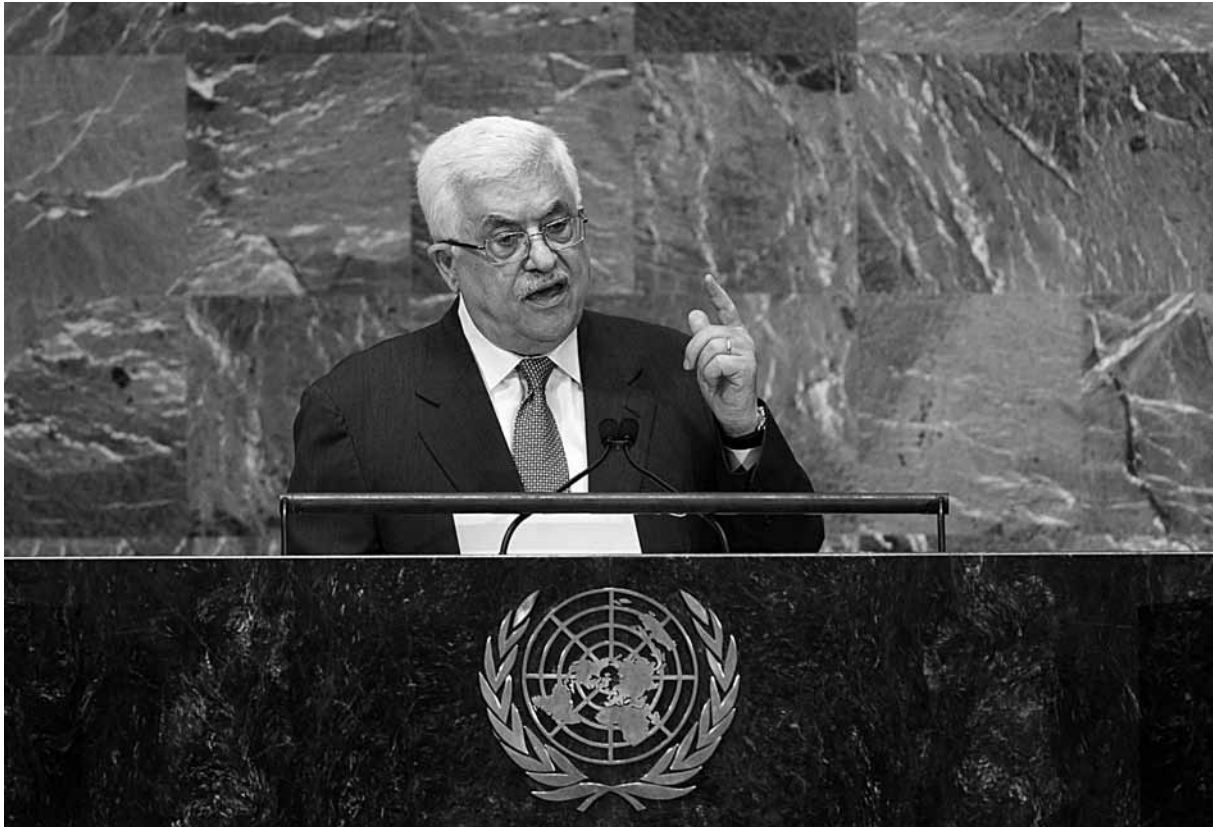
De Palestijnse President Mahmoed Abbas spreekt de Algemene Vergadering toe, 27 september 2012