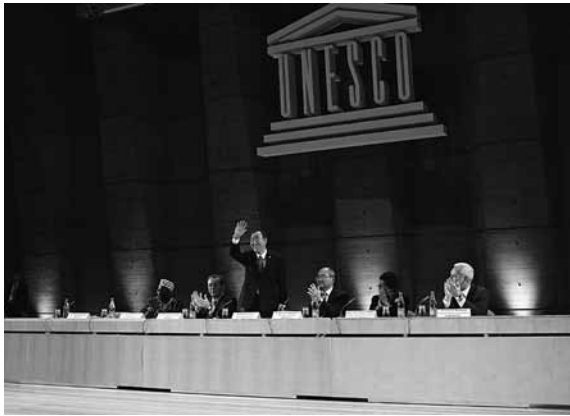
Secretaris-generaal Ban Ki-moon bezoekt het UNESCO hoofdkwartier in Parijs, 3 april 2009