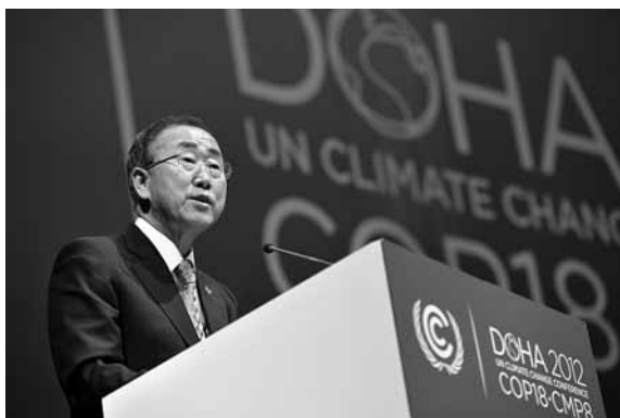
Secretaris-generaal Ban Ki-moon opent het 'high level segment' op de klimaatop in Doha, 4 december 2012.

maatverdrag (COP 18) door, alsook de achtste vergadering van de partijen bij het Kyoto Protocol (CMP 8). Te Doha werden enkele belangrijke beslissingen genomen, de 'Doha Climate Gateway' genoemd. Sedert een aantal jaren blijven belangrijke beslissingen uit die rekening houden met een nieuwe realiteit, namelijk een aantal ontwikkelingslanden (China, India, Brazilië) worden steeds grotere uitstoters van broeikasgassen als een gevolg van hun succesvolle economische ontwikkeling. Dit vertaalt zich echter niet in de huidige klimaatarchitectuur. Op het vlak van bindende afspraken om de emissies van broeikasgassen te reduceren (de zgn. 'mitigation') maken zowel het Klimaatverdrag en het Kyoto Protocol een onderscheid tussen ontwikkelde landen (Bijlage I-landen in het Klimaatverdrag) en ontwikkelingslanden. In het Kyoto Protocol hebben de Bijlage I-landen de verplichting aanvaard hun broeikasgasemissies gezamenlijk te reduceren met 5% in de periode 2008-2012, ook de eerste verbintenisperiode genoemd. Zoals bekend variëren de reducties van land tot land, gaande van 8% voor de toen 15 EU-landen tot een stijging met 10% voor IJsland ten opzichte van de uitstoot in 1990. Het was oorspronkelijk de bedoeling dat een nieuwe verbintenisperiode van start zou gaan vanaf 1 januari 2013, m.a.w. een amendement van kracht vanaf deze periode.