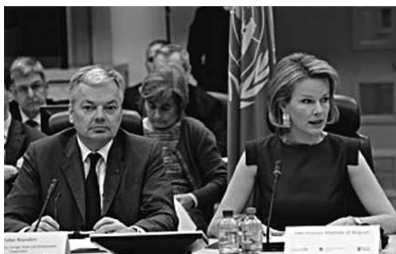
Minister Didier Reynders en HKH Prinses Mathilde tijdens de conferentie Children's Rights and Business Principles in Belgium

Het was op initiatief van de Federale Overheidsdienst Buitenlandse Zaken, onder leiderschap van Minister Didier Reynders en the Global Compact Network Belgium dat het Forum doorging op 3 december, in samenwerking met UNICEF België, de Koning Boudewijnstichting, beide kinderrechtencommissarissen, Save the Children , de Raad van Europa, de Europese Commissie, Antwerp Management School en de privé-sector. De aanwezigheid en ondersteuning van HKH Prinses Mathilde zette België eens te meer extra op de kaart als pionier op vlak van kinderrechten.