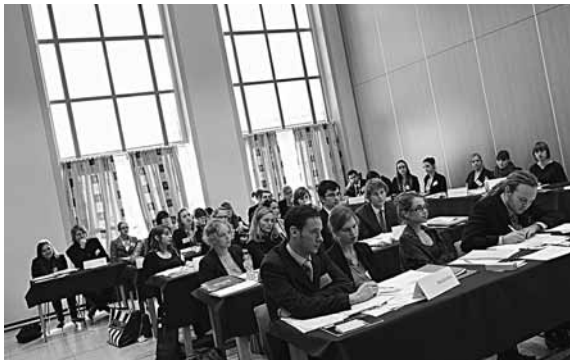
De Veilighedsraad in sessie - © Mathias Gullentops

De tweede onderhandelingsdag, 1 december , ging van start met een verrassingsaanval van Pakistan, de Verenigde Staten en de Russische Federatie, die naarstig hadden doorgewerkt aan een nieuwe working paper over de mogelijkheid om een Arctisch Investeringsfonds te creëren, dat zou afhangen van de Arctic Council . Hierbij zouden investerende naties in ruil voor hun monetaire steun voordelen verkrijgen